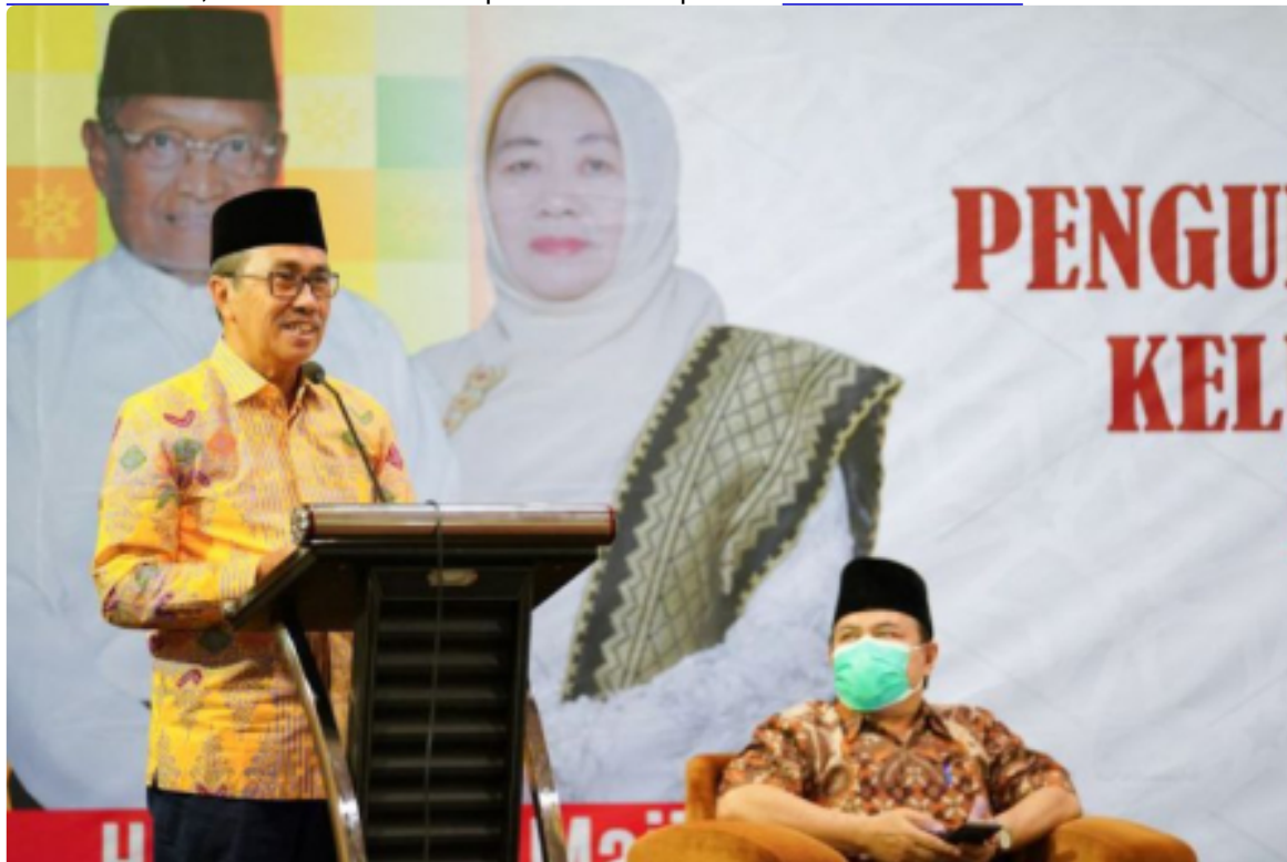
Gubernur Riau Minta Masyarakat Dukung Vaksinasi Booster Senin, 17 Januari 2022 | 13:18 WIB | Oleh MC PROV RIAU