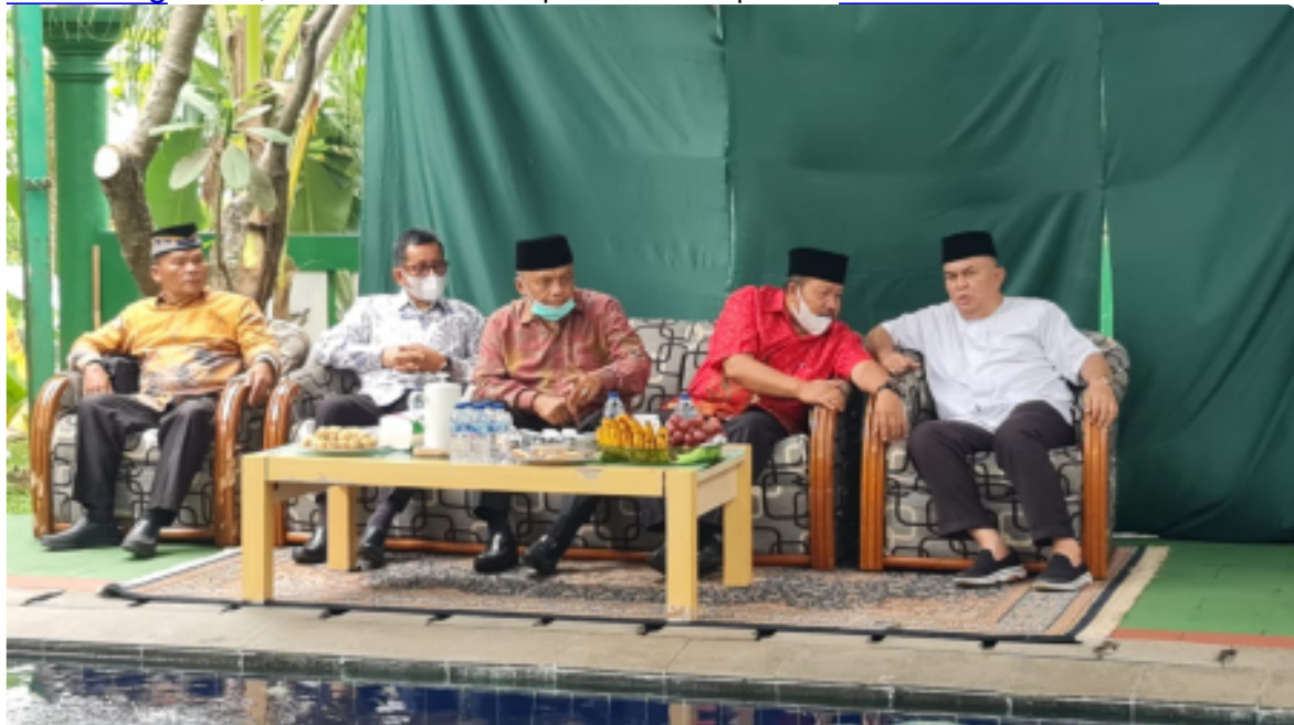
Rangkul Perantau Bangun Agama, Bupati Kunjungi IKKP Jabodetabek