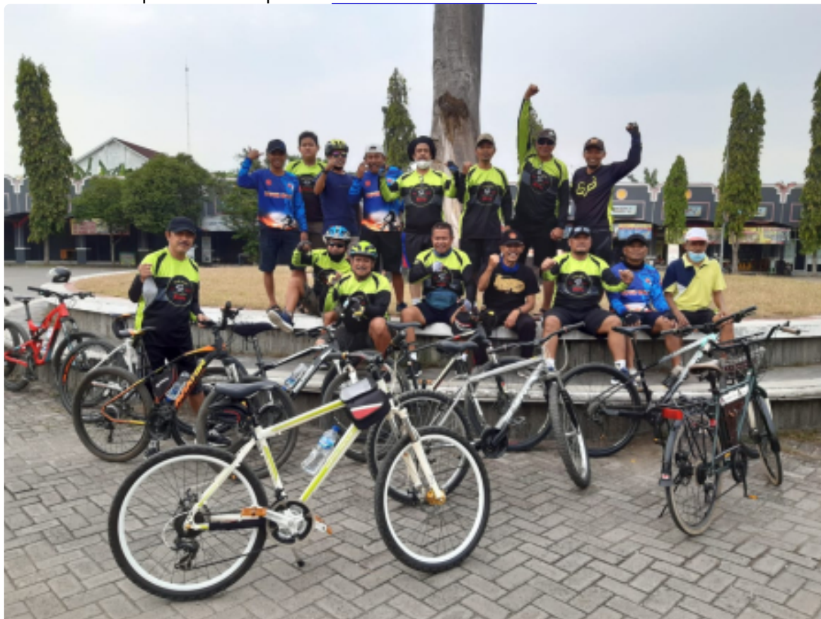
Pandemi, Komunitas Sepeda Ontel Dapur Wojo Blora Tumbuhkan Semangat Berbagi Senin, 17 Januari 2022 | 08:10 WIB | Oleh MC KAB BLORA