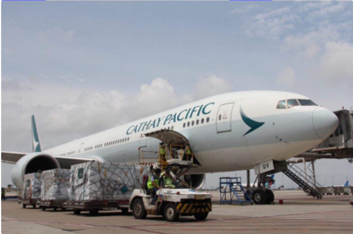
Sukseskan Vaksinasi Lanjutan, RI Terima Lima Juta Vaksin Sinovac Siang Ini Senin, 17 Januari 2022 | 14:57 WIB | Oleh Eko Budiono