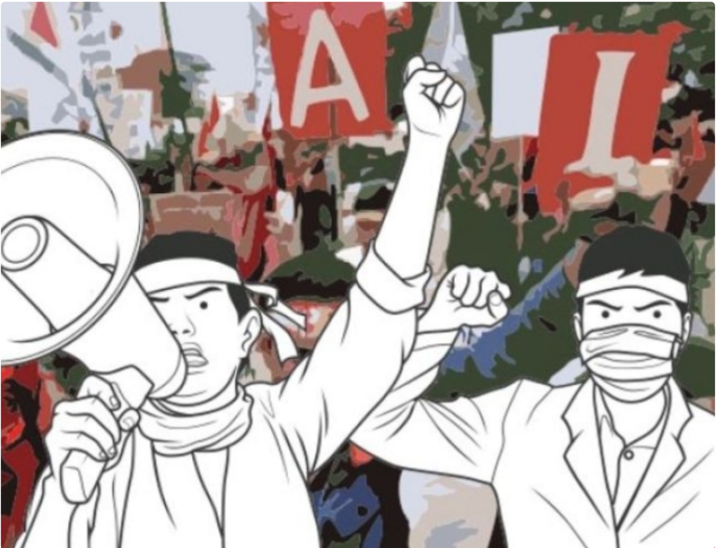
Ilustrasi Gambar Demo Masyarakat

PALANGKA RAYA - Paska divonis bebasnya bandar besar Narkoba, Salihin Bin Abdulah alias Saleh beberapa waktu oleh Majelis Hakim Negeri Pengadilan (PN) Palangka Raya, menuai kontroversi dan kecamatan masyarakat, khusus kota Palangka Raya.