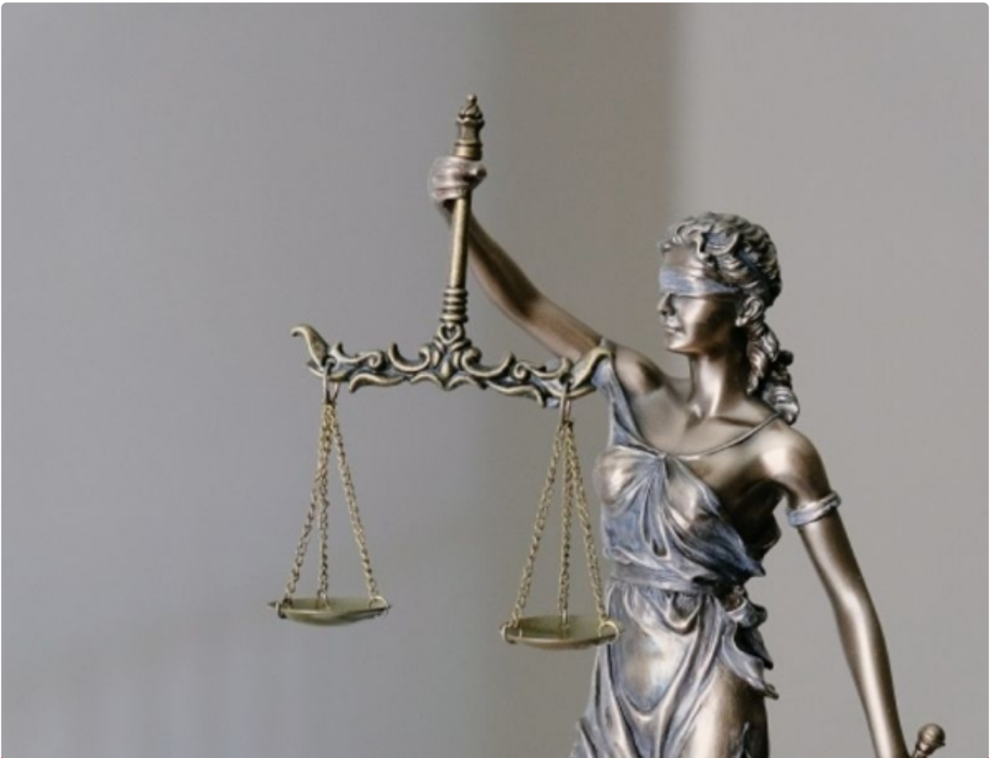
Gambar Ilustrasi Dewi Keadilan